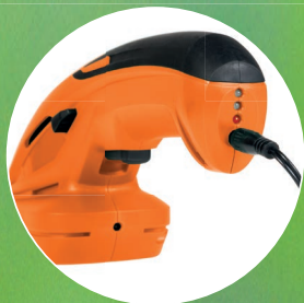
indikátor nabití battery charge indicator