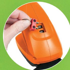
bezpečnostní spínač safety switch